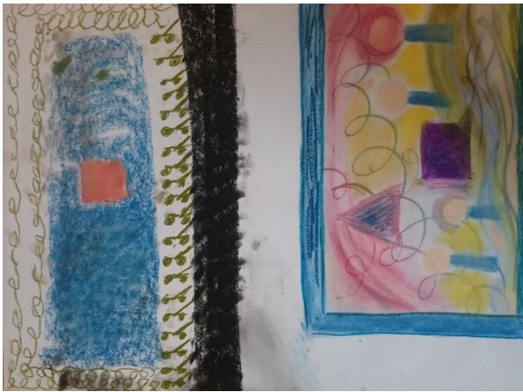
Samen op een vel; wantrouwen en angst komt tot uiting