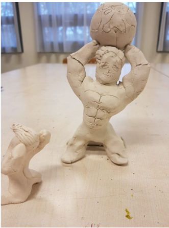
Macht versus onmacht. Door positioneren inzicht krijgen in en herkennen van schema's